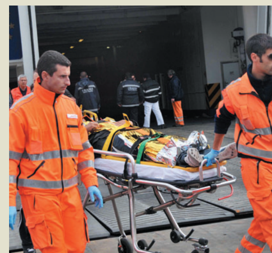
FERITI SULLA FANTASTIC all'entrata in porto