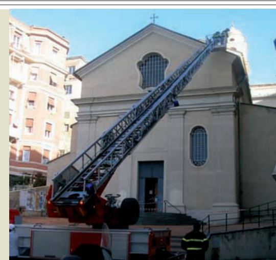
CHIESA DI SAN NICOLA Interventi dei pompieri