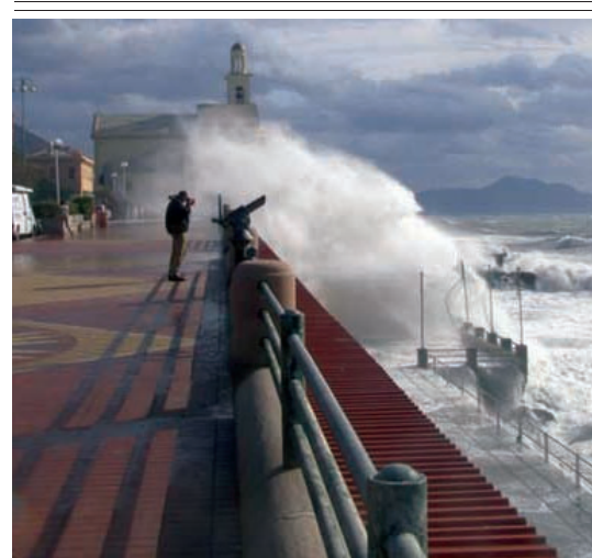
CORSO ITALIA Onde che arrivano in passeggiata