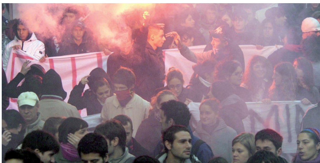
CORTEO La manifestazione degli studenti delle medie superiori e dell'Università ieri mattina

Manifestazione studentesca blocca la stazione Principe Cori contro la polizia. Burlando in corteo attacca il governo