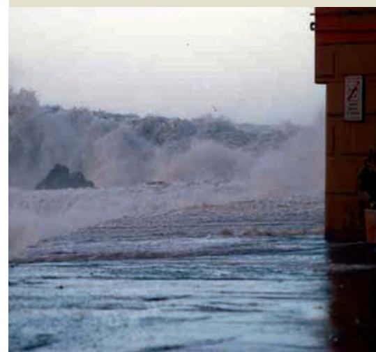
ALLAGAMENTI in molte zone sulla costa