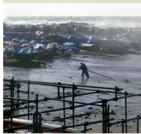
A PUNTA VAGNO Quel che resta delle barche